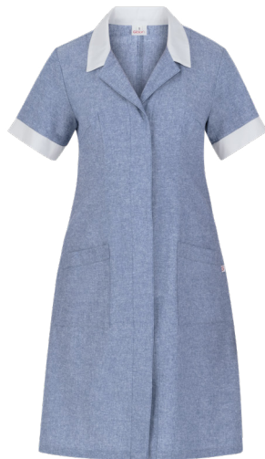
118 Light blue