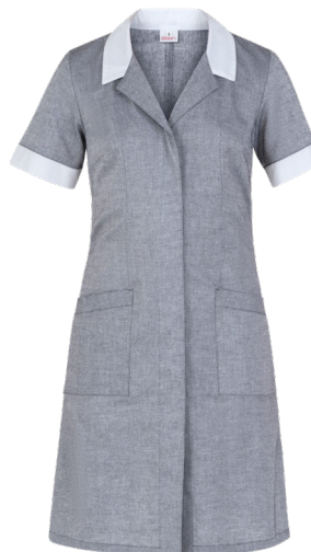
119 Grigio medio